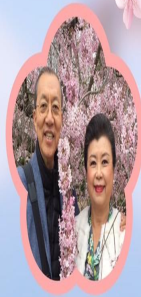
ประธานจัดงาน ประชุมใหญ่ ปี 2566

วันที่ 18-19 มีนาคม 2566 ณ สวนนนุช พัทยา จ.ชลบุรี