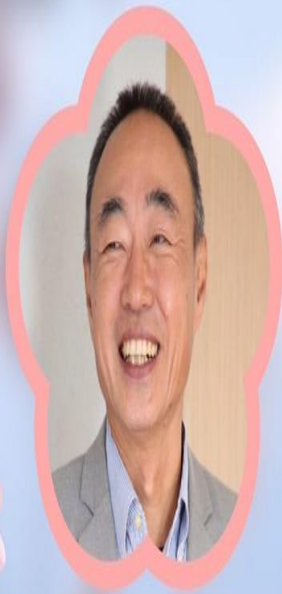
ผู้ว่าการภาค 2565-66