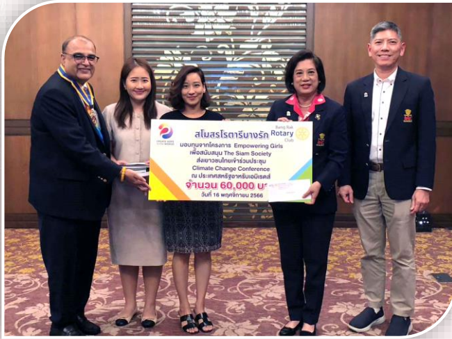
มอบทุนโครงการ Empowering Girls เพื่อสนับสนุน The Siam Society ส่งเยาวชนไทยเข้าร่วมประชุม Climate Change Conference ประเทศสหรัฐอเมริกาที่รับเอมิเรตส์ จำนวน 60,000 บาท