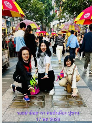
รอยฝ่ามือดาราคณดิ่งเมืองปูซาน 17 พค 2026