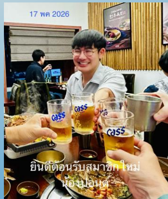
17 พค 2026