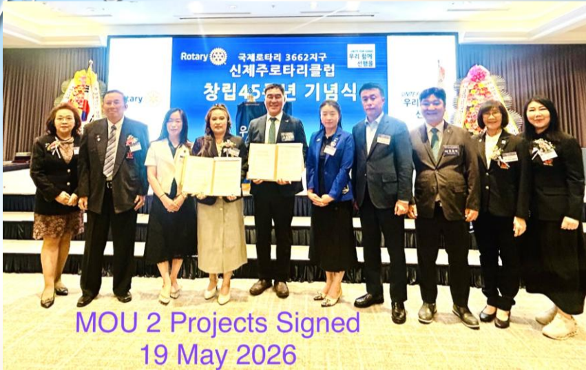
MOU 2 Projects Signed 19 May 2026