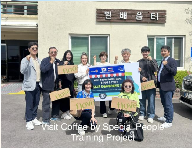
Visit Coffee by Special People Training Project